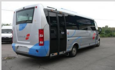
Sunrise Urbain GNC