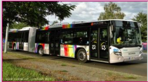
SCANIA Citywide LE (articulé 18 m)