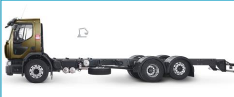
RENAULT TRUCKS Trucks D WIDE P6*2 320 CNG