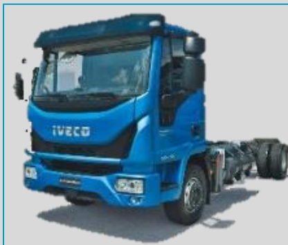
IVECO EuroCargo CNG 14 t à 16 t