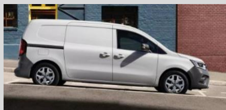
RENAULT KANGOO VAN LONG 1.3 TCE 130 ou 130 EDC