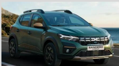
DACIA SANDERO 1.0 TCE 90