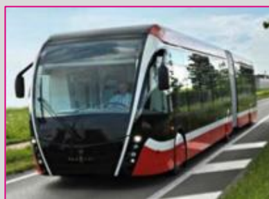
VAN HOOL Exqui. City