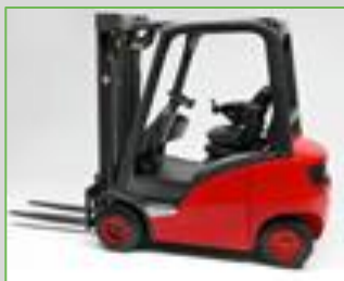
FENWICK 391 H16