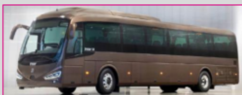
IRIZAR i4 GNV