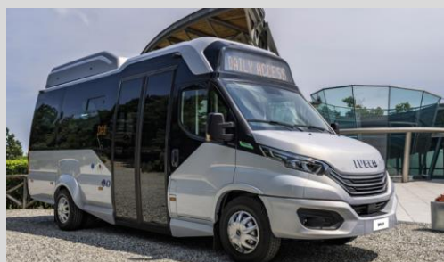
IVECO Daily Minicar GNV