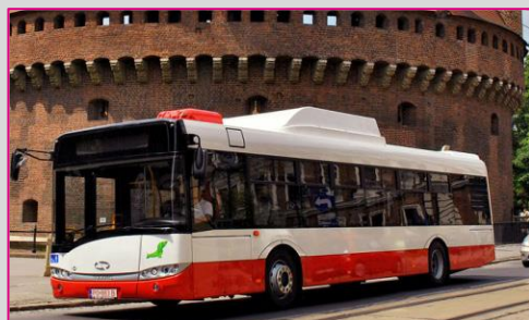
SOLARIS Urbino 12 CNG