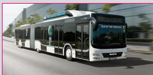
MAN Lion's City 12 ou 18 C