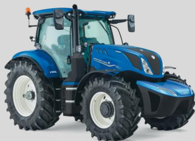
New Holland T6