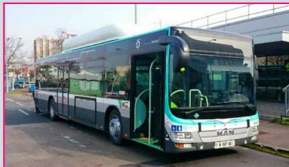
MAN Lion's City A36