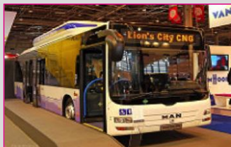
MAN Lion's City A20