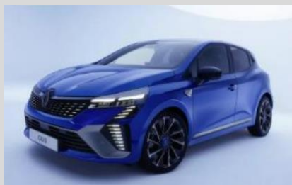
RENAULT CLIO 1.0 TCE 90