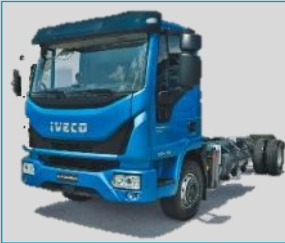
IVECO EuroCargo CNG 8 t à 12 t