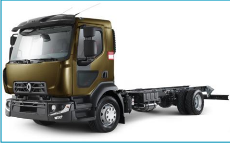
RENAULT TRUCKS Trucks D WIDE P4*2 320 CNG