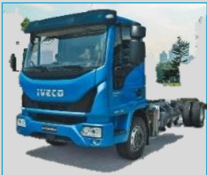
IVECO EuroCargo CNG 8 t à 12 t