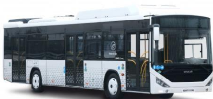
KENT C CNG