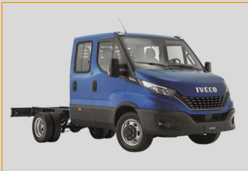
IVECO Daily Blue Power 3,5 t (roues jumelées)