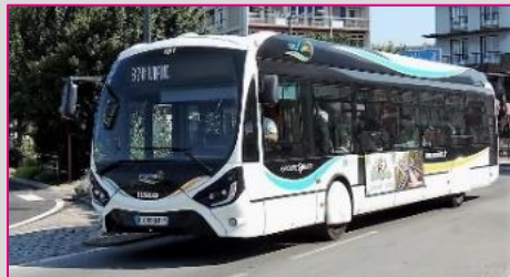
IVECO Crealis CNG 12 m