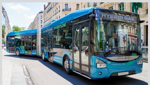
IVECO Urbanway 18 HYBRIDE