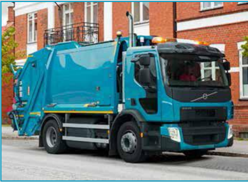
VOLVO FE GNC P 280 / 340 LA4*2MNA(B)