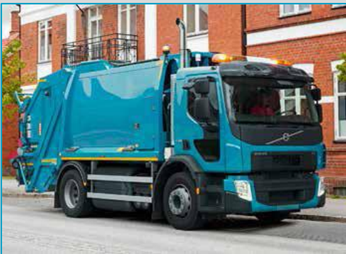
VOLVO FE GNC P 280 / 340 DB6*2*4MNA