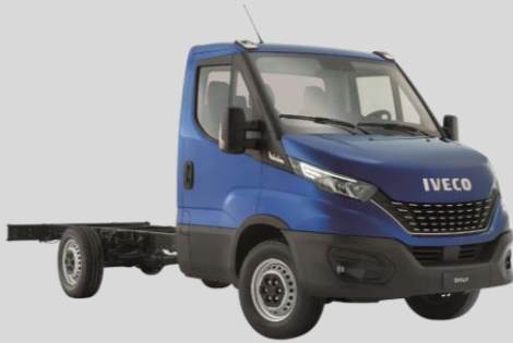
IVECO Daily Blue Power 3,5 t ≤ t ≤ 6,5 t (roues jumelées)