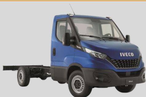
IVECO Daily Blue Power 3,5 t (roues simples)