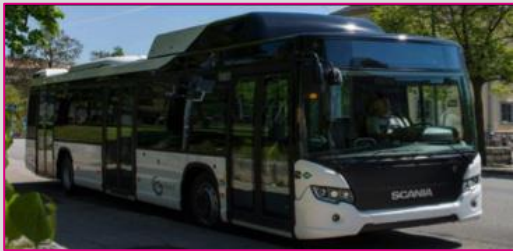
SCANIA Citywide LF (11 m)