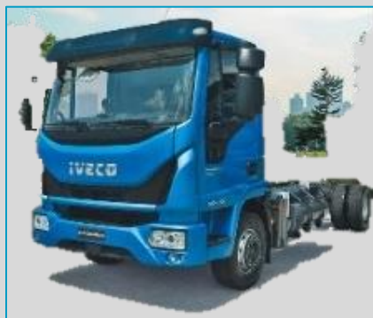
IVECO EuroCargo CNG 14 t à 16 t