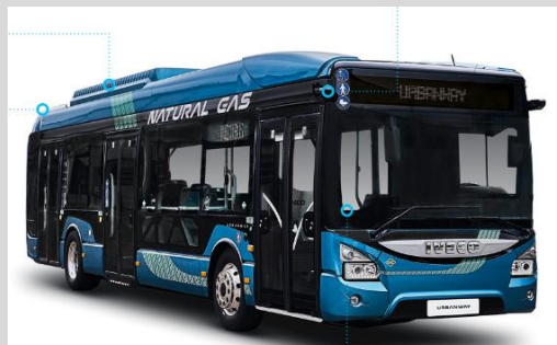
IVECO Urbanway 10 HYBRIDE