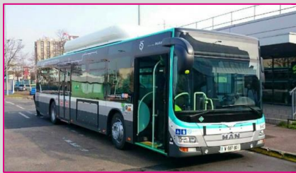
MAN Lion's City A26