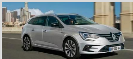
RENAULT MEGANE ESTATE 1.3 TCE 140 EDC