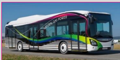
IVECO Urbanway 12 CNG