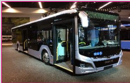
MAN Lion's City 12 CNG Option Efficient Hybrid