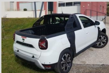
DACIA DUSTER Pick Up 4x4 1.3 TCE 150