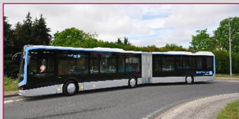
MAN Lion's City 18C Option Efficient Hybrid