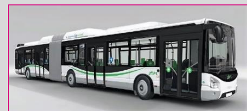
IVECO Urbanway 18 CNG