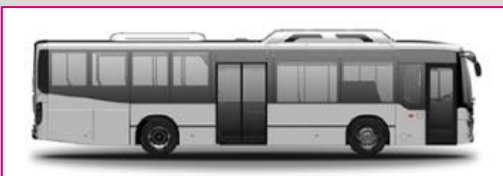
SCANIA Citywide Suburbain