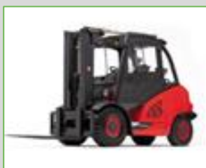
FENWICK 394 H45