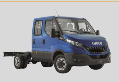
IVECO Daily Blue Power 3,5 t ≤ t ≤ 6,5 t (roues jumelées)