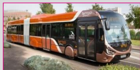
IVECO Crealis CNG 18 m