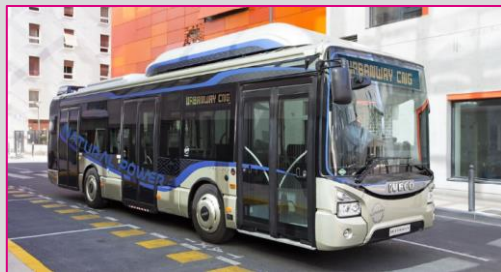
IVECO Urbanway 10 CNG