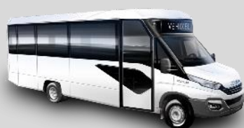
TROUILLET Scool 34