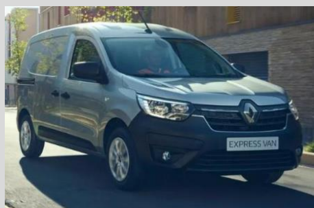
RENAULT EXPRESS VAN 1.3 TCE 100