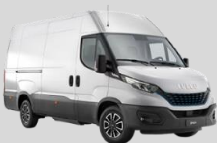
IVECO Daily Blue Power 3,5 t ≤ t ≤ 6,5 t (roues jumelées)