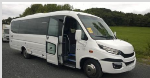
SUNRISE SCOLAIRE GAZ GNC