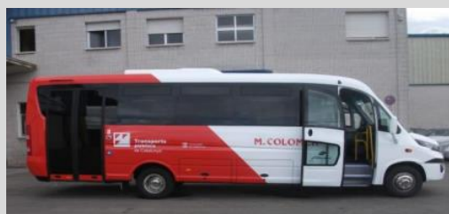
Sunrise Semi- Urbain GAZ GNC