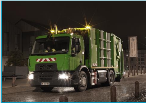
RENAULT TRUCKS Trucks D WIDE P6*2 BOM 320 CNG