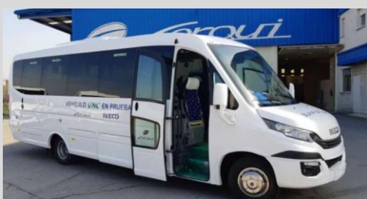
SUNRISE PMR GNC