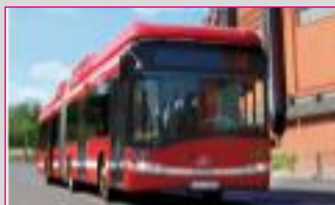
SOLARIS Urbino 18 CNG