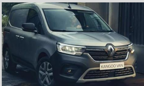
RENAULT KANGOO VAN 1.3 TCE 100 ou 130