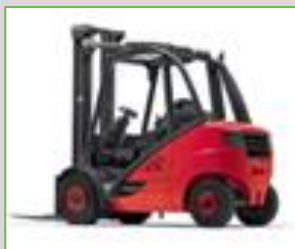
FENWICK 393 H30