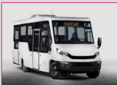
INDCAR Mobi City